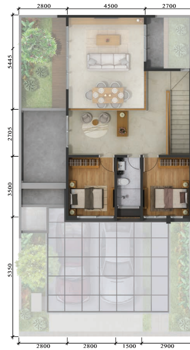
3 rd Floor