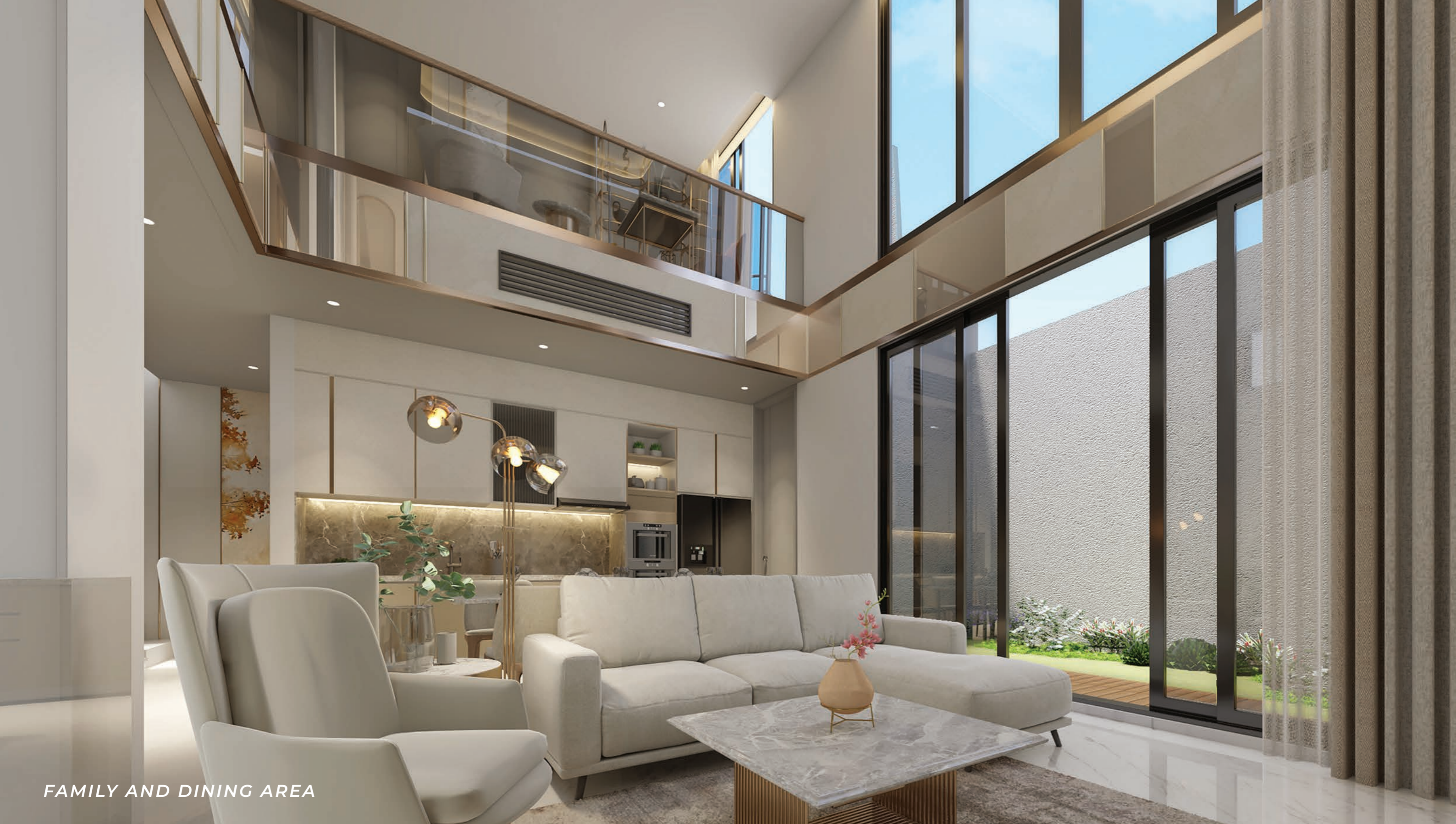
FAMILY AND DINING AREA