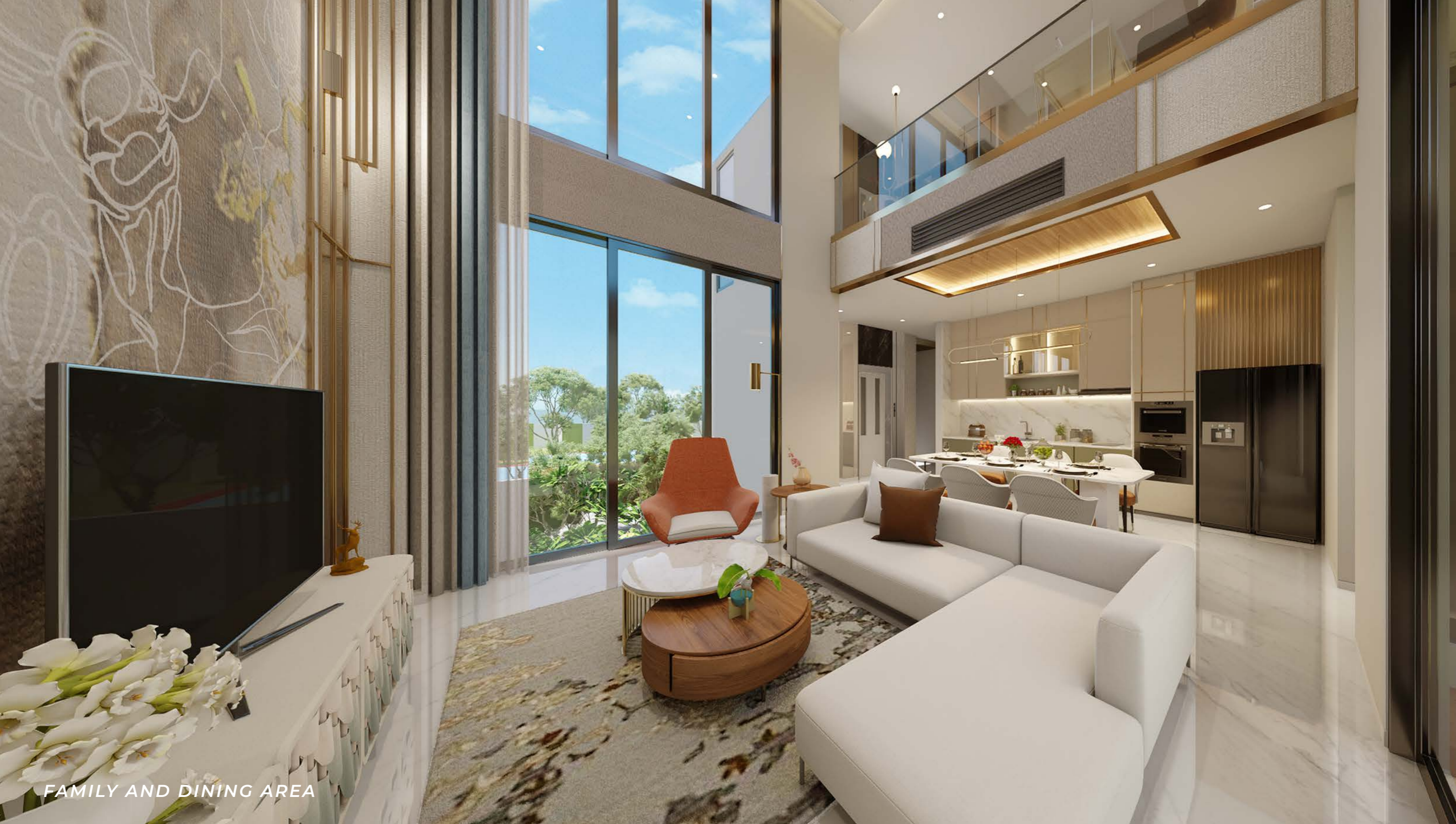
FAMILY AND DINING AREA