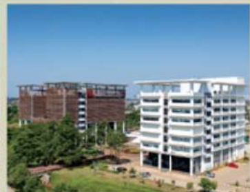
UNIVERSITAS PEMBANGUNAN JAYA

Catatan : Gambar ini merupakan ilustrasi artis. Perubahan dapat terjadi disesuaikan dengan kondisi lapangan. Brosur ini tidak dapat menjadi bagian dari penawaran penjualan/perjanjian tertulis ataupun alat pembuktian hukum lainnya. Untuk pengembangan rancangan, spesifikasi tidak mengikat dan sewaktu-waktu dapat berubah. Fasilitas listrik disesuaikan dengan ketersediaan dan spesifikasi standar PLN.