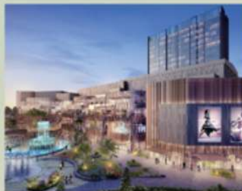
BINTARO XCHANGE MALL