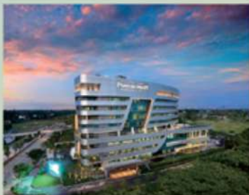
RUMAH SAKIT PONDOK INDAH BINTARO