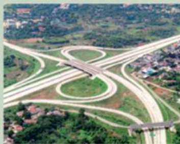
TOL SIMPANG SUSUN PARIGI